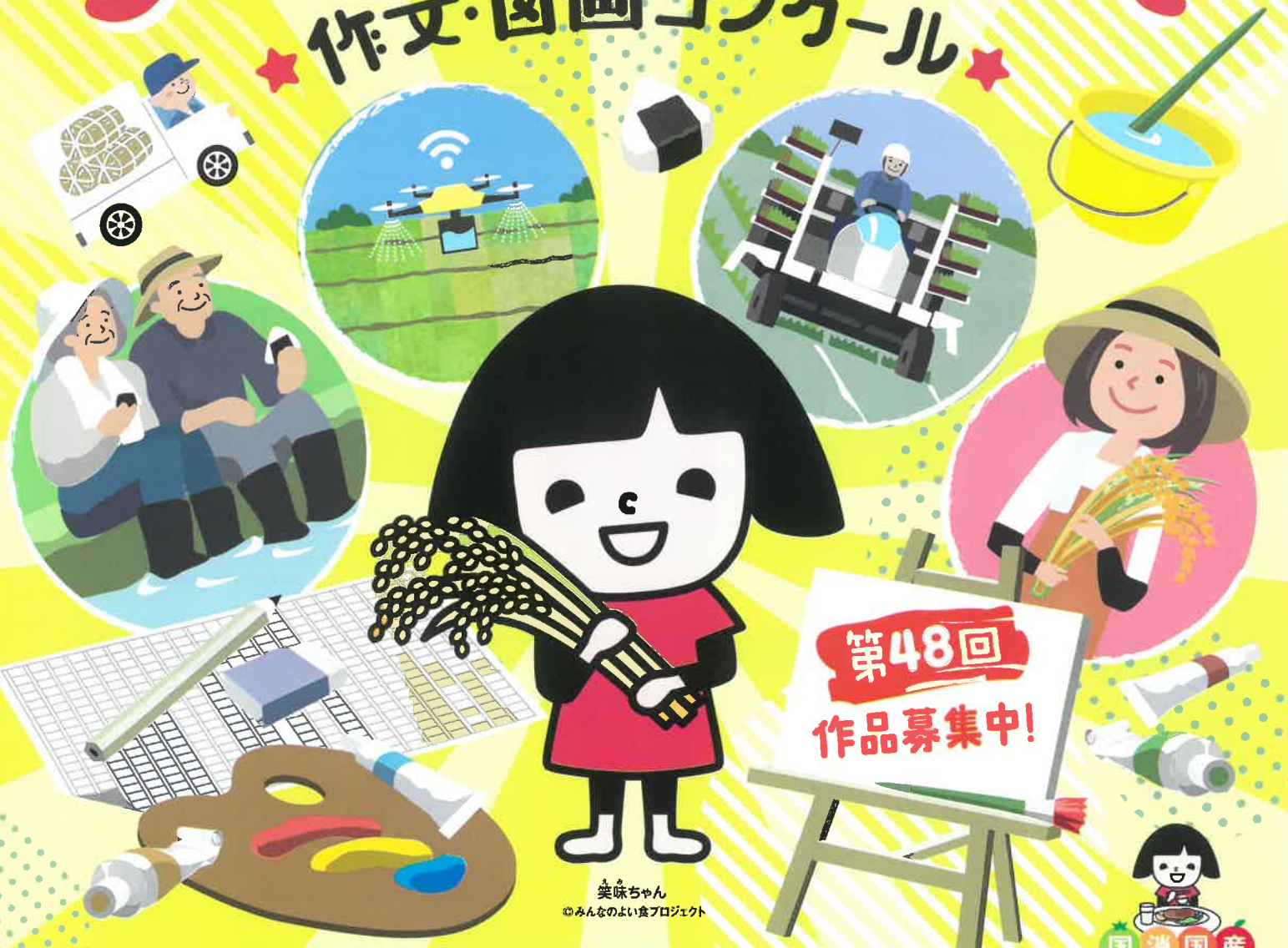
笑味ちゃん みんなのよい食プロジェクト